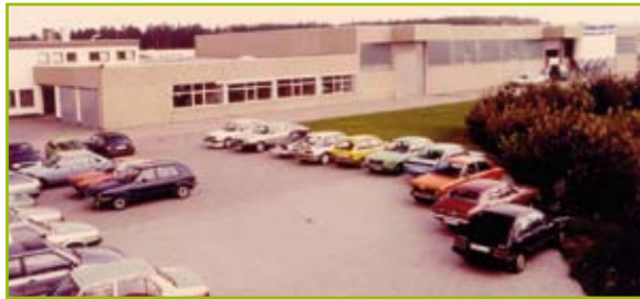
80er Jahre | 80s